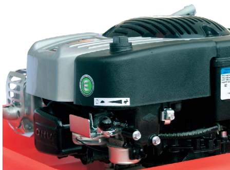
Poloha VOLNOBĚH (želva)