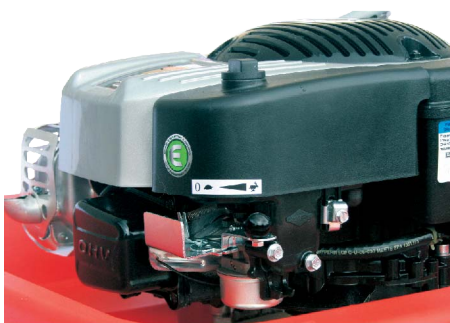
Poloha PROVOZ (zajíc)

Zastavení zařízení provedete posunutím akcelerační páky do polohy Stop ("0"). Odpojte připojenou hadici a stroj vynesete z vodního zdroje. Čerpadlo není potřeba odvodňovat, zbytková voda vyteče přes víko ven.