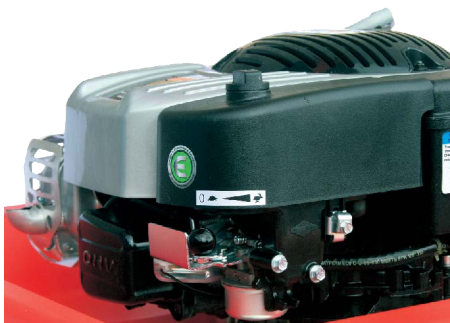
Poloha STOP (nula)