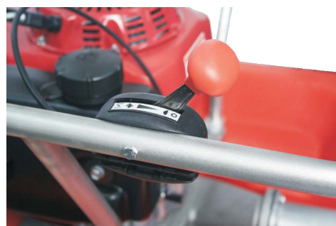
Poloha STOP (nula)