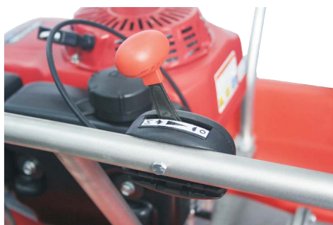
Poloha PROVOZ (zajíc)