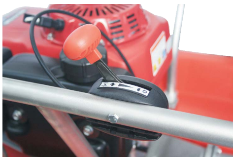
Poloha SYTIČ (klapka)

Zastavení zařízení provedete posunutím akcelerační páky do polohy Stop. Odpojte připojenou hadici a stroj vynesete z vodního zdroje. Čerpadlo není potřeba odvodňovat, zbytková voda vyteče přes víko čerpadla.