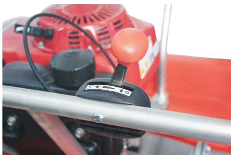
Poloha VOLNOBĚH (želva)